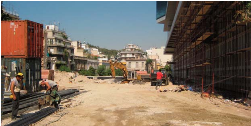
Η «Αλάνα» απ' τη μεριά της οδού Χατζηχρήστου. (Φωτο Α.Κ.Α 4-7-07)

για τα οποία τόσο μελάνι χύθηκε πρόσφατα (βλ.π.χ «Η Καθημερινή», 3, 4, Ιουλίου 2007, «Η Αυγή», 5-7-07, κτλ.) υπάρχει κίνδυνος να εξαφανιστούν για πάντα. Πρόκειται για έγκλημα όπου όλες οι πρόσφατες μεταφορές περί φωτιάς και δάσους , μέσα από ένα καθαρό λόγο αρχιτεκτονικό, τον λόγο που θα ακουστεί και ακούγεται στις αρχιτεκτονικές σχολές, τότε που συλλαμβάνεται ή τότε που κρίνεται αν θα γίνει αποδεκτό προς υλοποίηση ένα αρχιτεκτόνημα, βρίσκεται στην κριτική ημερήσια διάταξη. Εκεί δεν χωράν επιχειρήματα του στυλ «απαγορεύεται», «αποχαρακτηριστέο/διατηρητέο ή μη», αλλά ανάμεσα σε πολλά, πάρα πολλά άλλα, τίθενται και τα ουσιαστικότερα θέματα και ερωτήματα περί «κλίμακος», αναλογιών, ρυθμού, μεγέθους, γενικά περιβαλλοντικών παραγόντων, και πάνω, μα πάνω απ' όλα: «τι θέλει να είναι αυτό το κτήριο; (what does the building want to be?», του όντως κορυφαίου Αμερικανού αρχιτέκτονα Louis Kahn).