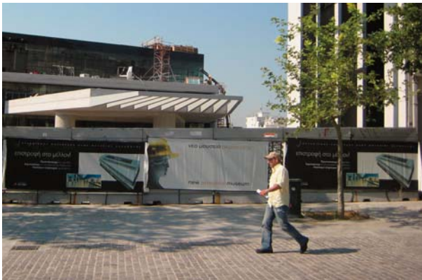
Είσοδος του Νέου Μουσείου της Ακρόπολης απο την Διονυσίου Αρεοπαγίτου

Η γνώμη μου είναι ότι ο μελλοντικός «Κάτω Παρθενώνας», κατ' ευφημισσμόν αποκαλούμενος Νέο Μουσείο της Ακρόπολης, είναι το μεγαλύτερο έγκλημα των ημερών μας, ακόμη μεγαλύτερο και από τον καταστροφικό πρόσφατο χαμό του Εθνικού δρυμού της Πάρνηθας. Γιατί όπως μας λένε ο Δρυμός σε 100 χρόνια θα αποκατασταθεί, το συντελούμενο αρχιτεκτονικό ανοσιούργημα θα παραμείνει, τα δε κτήρια της Διονυσίου Αρεοπαγίτου 17 -19,