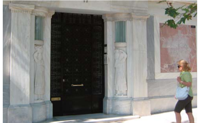
Είσοδος του προτεινόμενου για κατεδάφιση κτηρίου του αρχιτέκτονα Κουρεμένου. Διονυσίου Αρεοπαγίτου 17 (φωτο Α.Κ.Α 4-7-07)

για τα οποία τόσο μελάνι χύθηκε πρόσφατα (βλ.π.χ «Η Καθημερινή», 3, 4, Ιουλίου 2007, «Η Αυγή», 5-7-07, κτλ.) υπάρχει κίνδυνος να εξαφανιστούν για πάντα. Πρόκειται για έγκλημα όπου όλες οι πρόσφατες μεταφορές περί φωτιάς και δάσους , μέσα από ένα καθαρό λόγο αρχιτεκτονικό, τον λόγο που θα ακουστεί και ακούγεται στις αρχιτεκτονικές σχολές, τότε που συλλαμβάνεται ή τότε που κρίνεται αν θα γίνει αποδεκτό προς υλοποίηση ένα αρχιτεκτόνημα, βρίσκεται στην κριτική ημερήσια διάταξη. Εκεί δεν χωράν επιχειρήματα του στυλ «απαγορεύεται», «αποχαρακτηριστέο/διατηρητέο ή μη», αλλά ανάμεσα σε πολλά, πάρα πολλά άλλα, τίθενται και τα ουσιαστικότερα θέματα και ερωτήματα περί «κλίμακος», αναλογιών, ρυθμού, μεγέθους, γενικά περιβαλλοντικών παραγόντων, και πάνω, μα πάνω απ' όλα: «τι θέλει να είναι αυτό το κτήριο; (what does the building want to be?», του όντως κορυφαίου Αμερικανού αρχιτέκτονα Louis Kahn).